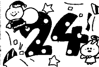
そして戦後、給食が再び始まったのが12月24日！