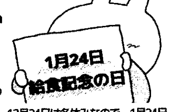
12月24日は冬休みなので、1月24日を記念日とし、給食について考える週間としています。