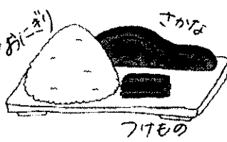
それは、お風呂はんを持ってこれない子供たちのためのものでした。