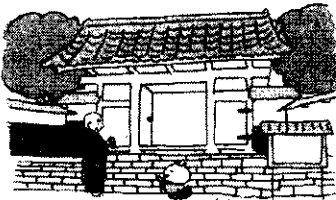
明治時代、山形県鶴岡市にある大蔵寺で給食が始まりました。