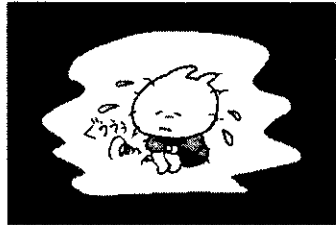
全国の子供たちは、お腹を空かせてやせほそってしまいます。